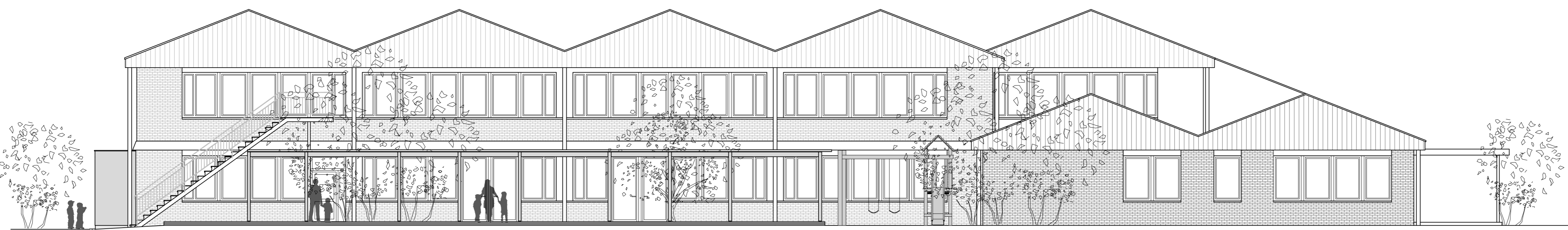
SZ FASADA – NOVO