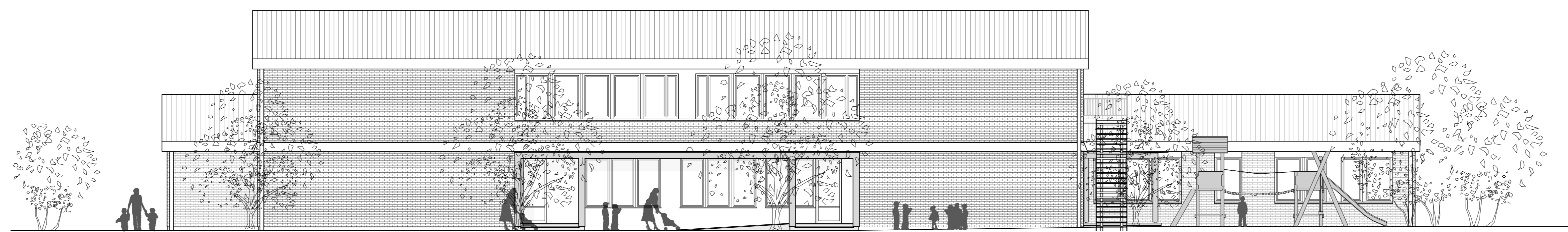
SV FASADA – NOVO